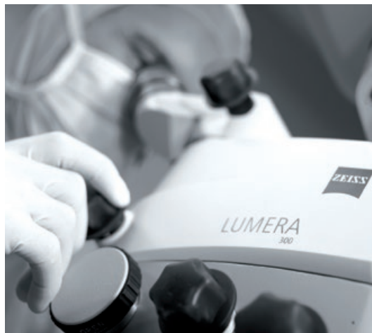
Pruebe una calidad excepcional

Y con los paquetes de servicio OPTIME de ZEISS que incluyen desde el mantenimiento preventivo al correctivo, así como piezas de repuesto, puede contar con la máxima disponibilidad del sistema y comodidad.